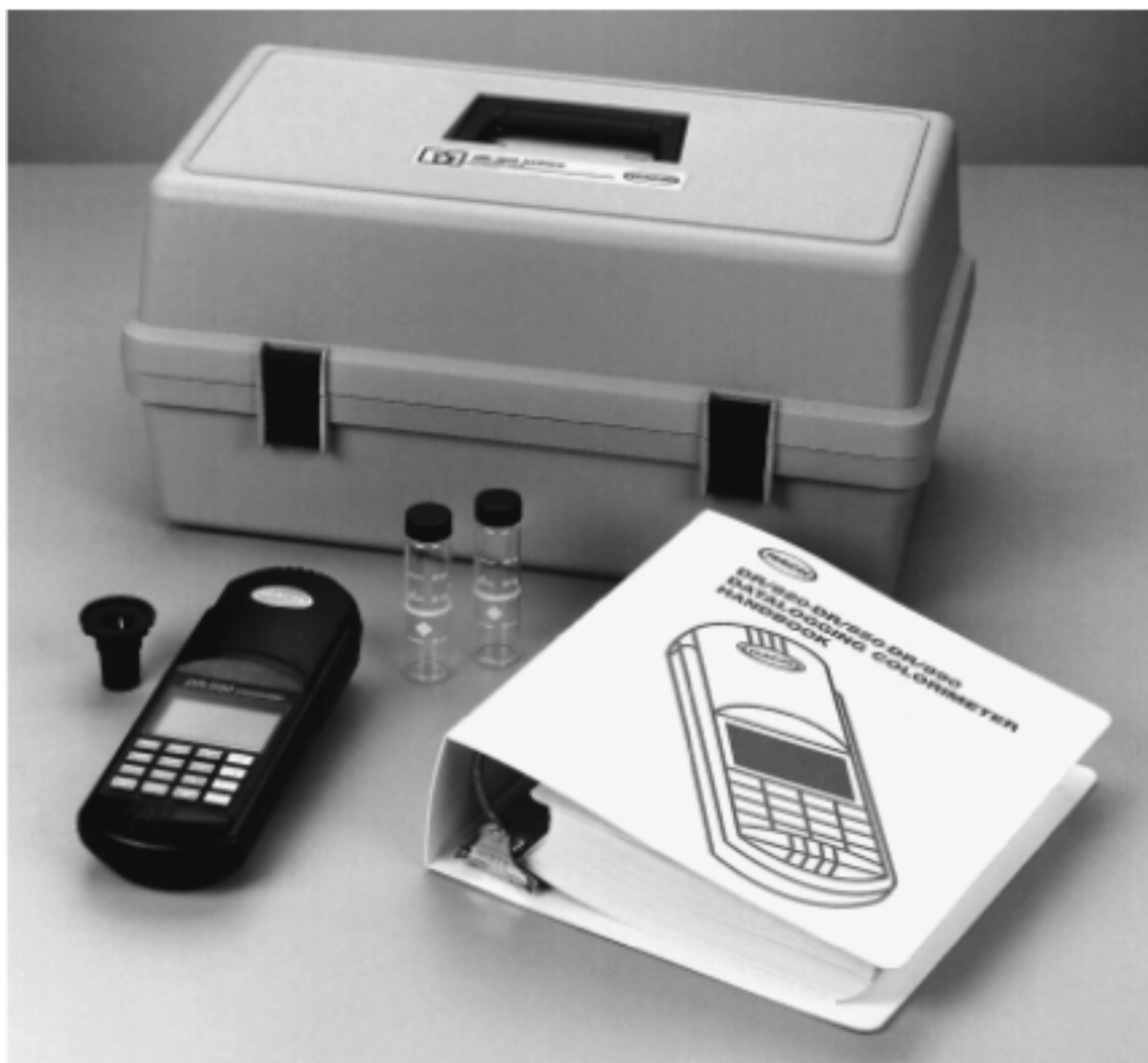
图 1 DR/800 系列色度仪标准包装*